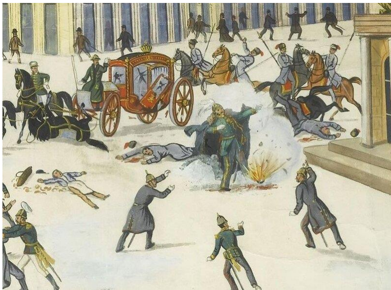
Убийство Александра II

Понятие "терроризм", "террорист", появилось во Франции в конце 18 века. Так называли себя якобинцы. Во время Великой французской революции слово "терроризм" превратилось в синоним преступника. В 1881 г. в России народовольцами с помощью самодельной бомбы был убит царь Александр II. В 1911 г. был убит агентом охраны председатель Совета министров П. А. Столыпин. В период 1902-1907 гг. террористами в России были осуществлены около 5,5 тыс. террористических актов. Жертвами их стали министры, депутаты Государственной Думы, жандармы, полицейские и прокурорские работники.