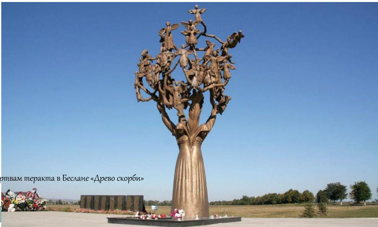
Память жертвам теракта в Беслане «Древо скорби»

Вспоминают 3 сентября также жертв и других терактов, происходивших в нашей стране – в Москве, Волгограде, а также в Чечне, Дагестане, Буденновске, Первомайском и других городах и поселках.