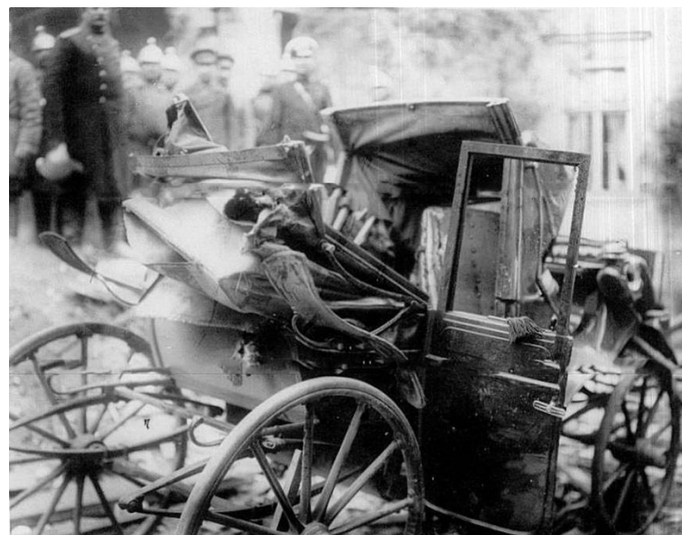
Убийство Петра Столыпина